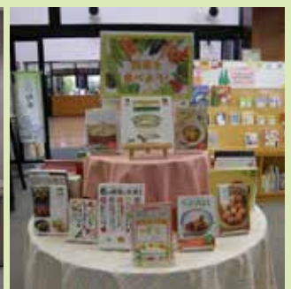
健康づくり課 食育展示 × 図書館 市内全 11 図書館 2019.5.28-6.17