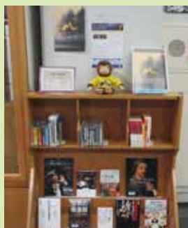
国際音楽祭推進課 セイジオザワ松本 フェスティバル × 図書館 中央図書館 2階 2019.7.26-8.23