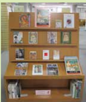
美術館 みんなのミュシャ展 × 図書館 中央図書館 2階 2020.10.23-11.27

松本市の各部署・施設とは、今までにも数々の連携したテーマ展示を行ってきました。 これからも、資料で深まるさまざまな企画を考えていきますので、お楽しみに！