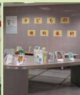
こども育成課 松本市子どもの権利に 関する条例 × 図書館 中央図書館 1階ロビー 2019.7.16-26