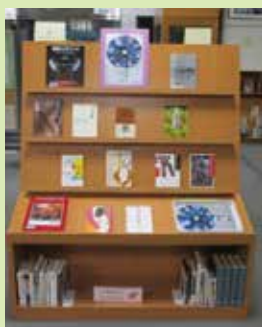
市民芸術館 真夏の夜の夢 × 図書館 中央図書館 2階 2020.9.25-10.23